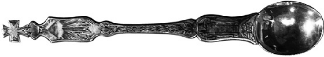
Сл. 13. Ложица од сребра са оруђима страдања Христових, црква Светих Апостола Петра и Павла у Лозовику 1854. година.