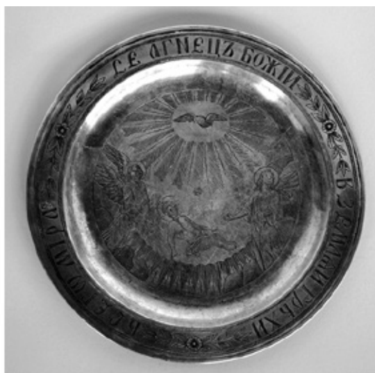
Сл. 15. Дискоси од сребра са представом поклоњења Христу Агнецу, црква у Лозовику (лево) и манастир Каленић (десно), 1854. година.