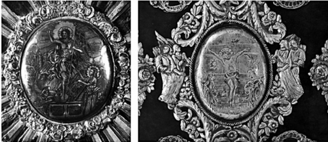
Сл. 8. Сребрни медаљони са представама изведеним техником нијела: Васкрсење Христово, оков лозовичког Јеванђеља (лево) и Распеће Христово са окова Јеванђеља манастира Петковице (десно).

садржао гарез и пекмез од шљиве. Ова смеша употребљавана је за украшавање металних површина а нарочито бакра (РАДОЈКОВИЋ 1966: 100–102).