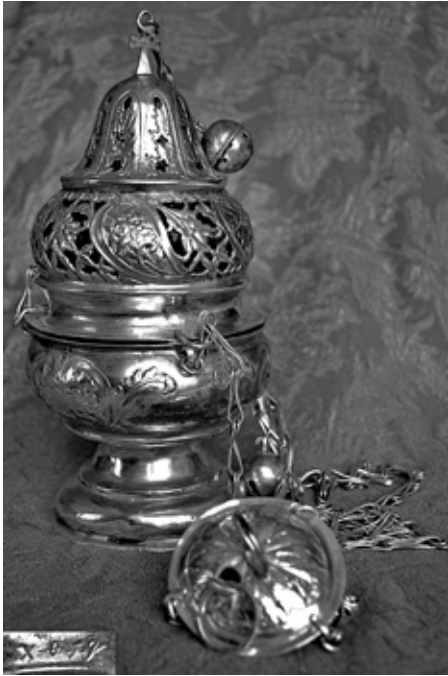
Сл. 9. Сребрна кадионица манастира Раковица, 1853. година.