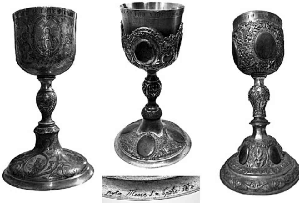
Сл. 11. Путири од позлаћеног сребра: црква Светих Апостола Петра и Павла у Лозовику, 1854. година (лево); манастир Каленић, 1854. година (средина); манастир Петковица код Шапца, 1853. година (десно).