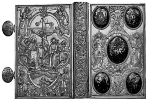
Сл. 2. Сребрни оков Јеванђеља манастира Симонопетра на Светој Гори, 1848. година.