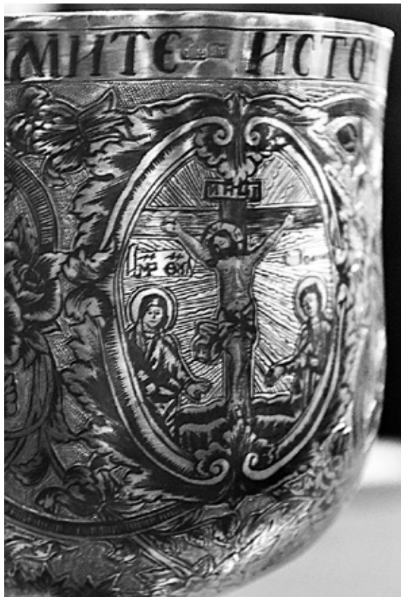
Сл. 12. Распеће Христово, детаљ чаше путира цркве у Лозовику, позлаћено сребро и нијело, 1854. година.

Путир лозовичке цркве настао је извесно око 1854. године када је приложено и престоно Јеванђеље. Уз овај путир у комплекту су израђени дискос и ложица за причешће. Ови предмети обликовани су у потпуности од сребра високе чистоће од 15 лота. Декорација је изведена гравирањем, позлатом и техником нијела који на углачаној сребрној основи стварају богато контрастирану полихромију. Чаша путира је украшена врежама и букетима расцветалих ружа и подељена на четири сегмента односно картуша. У првом је представа Исуса Христа који благосиља вино у чаши, бочно су према форми Деизиса приказани Пресвета Богородица и крилати Јован Претеча. У четвртном картушу је сцена Распећа Христовог са Богородицом и Јованом Богословом прецизно гравирани и допуњена нијелом (сл. 12). На стопи путира гравирани су медаљони са Јеванђелистима и преплетом винове лозе са крупним гроздовима и лишћем који носе старе евхаристијске симболичне конотације (ДАУТОВИЋ 2014: 173–176). Графичка вештина којом су приказани ликови и изведена