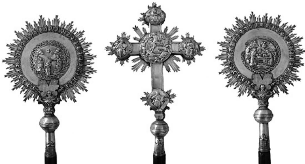
Сл. 10. Пар сребрних рипида и литијски крст, Стара црква у Крагујевцу, 1853. година.

Масиван литијски крст садржи у средишту картуше са сценом Распећа на првој и Васкрсења Христовог на другој страни, окружене у пресеку крака светлосним зрацима. Краци крста завршени су четворолисним картушима са зрацима светла. На првој страни Христово Распеће фланкирају фигуре анђела док је у позадини приказ Светог града Јерусалима.