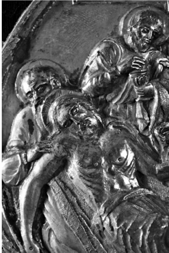
Сл. 6. Полагање у гроб и оплакивање Христово, детаљ окова лозовичког Јеванђеља.

(ДАУТОВИЋ 2018: 236). Хронолошки оков овог Јеванђеља треба да је настао годину дана пре лозовичког коме наликује по начину окивања дрвених корица пресвучених сомотом. Рубове Јеванђеља окружује обострано веома декоративна бордура, обликована ажурирањем од шкољкастих форми и рокајних волута и ваза које наликују рогу изобиља са букетима цвећа. У оквирима од волута су на предњој корици у угловима представљени медаљони са Јеванђелистима праћеним њиховим персонификацијама, док је у средишту сцена Распећа Христовог у богатом барокном флорално-вегетабилном оквиру који придржавају анђели. Представе у медаљонима изведене су техником нијелирања. Грб српске кнежевине такође се нашао на предњем окову Јеванђеља манастира Петковице. Хрбат је подељен у пет ажурираних сегмената, по два бочна садрже представе Херувима док је у средишњем приказан Бог Отац допјасно у облаци, док је у подножју приказана црква између два анђела. Задња корица не разликује се много од предње, а централни медаљон садржи сцену Васкрсења Христовог 12 (ЂОРЂЕВИЋ 2022: 226–227).