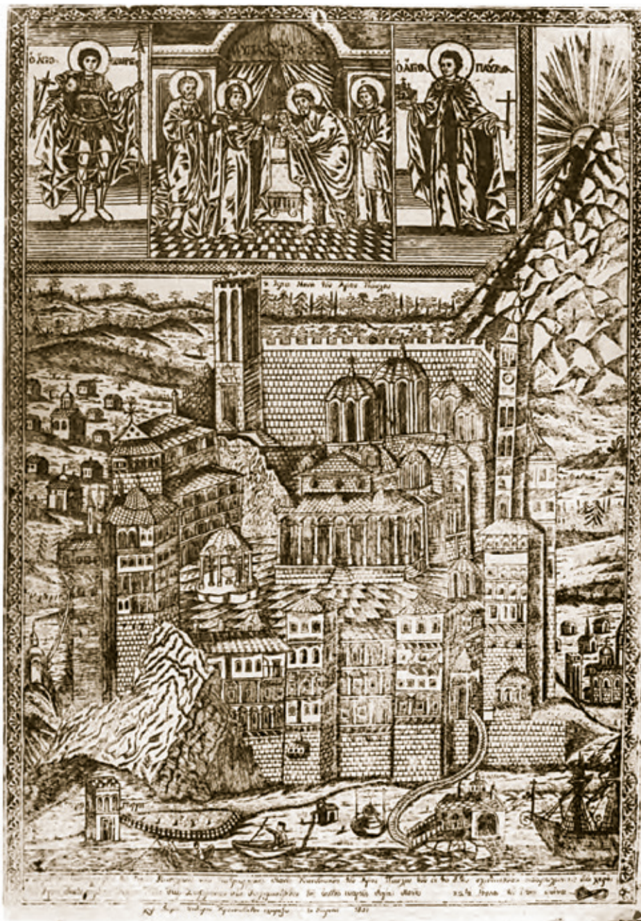
Сл. 3. Бакрорезна графика, ведута манастира Светог Павла на Светој Гори, гравирао Тома Исидоровић из Крушева, Кареја 1851. година.